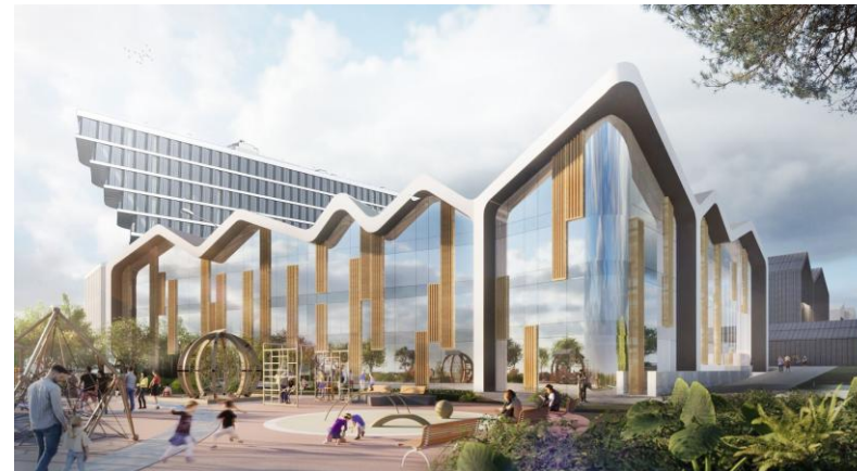
Дом со скатными крышами