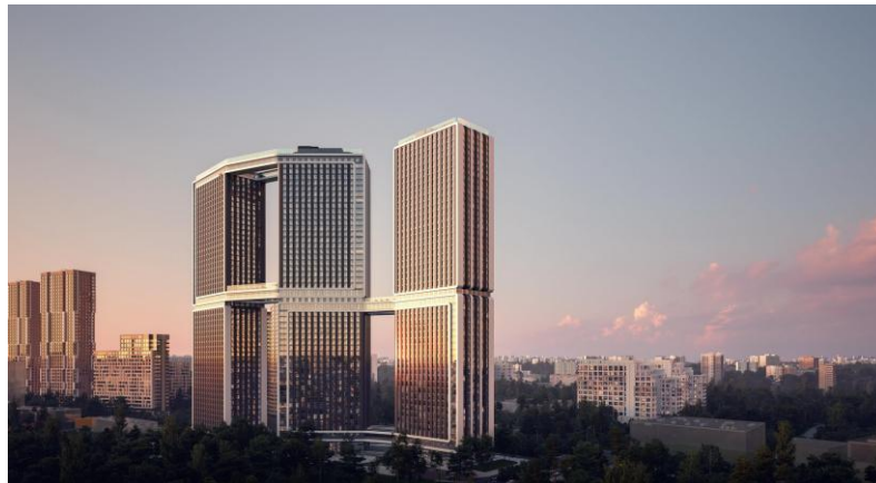
Башни с мостами