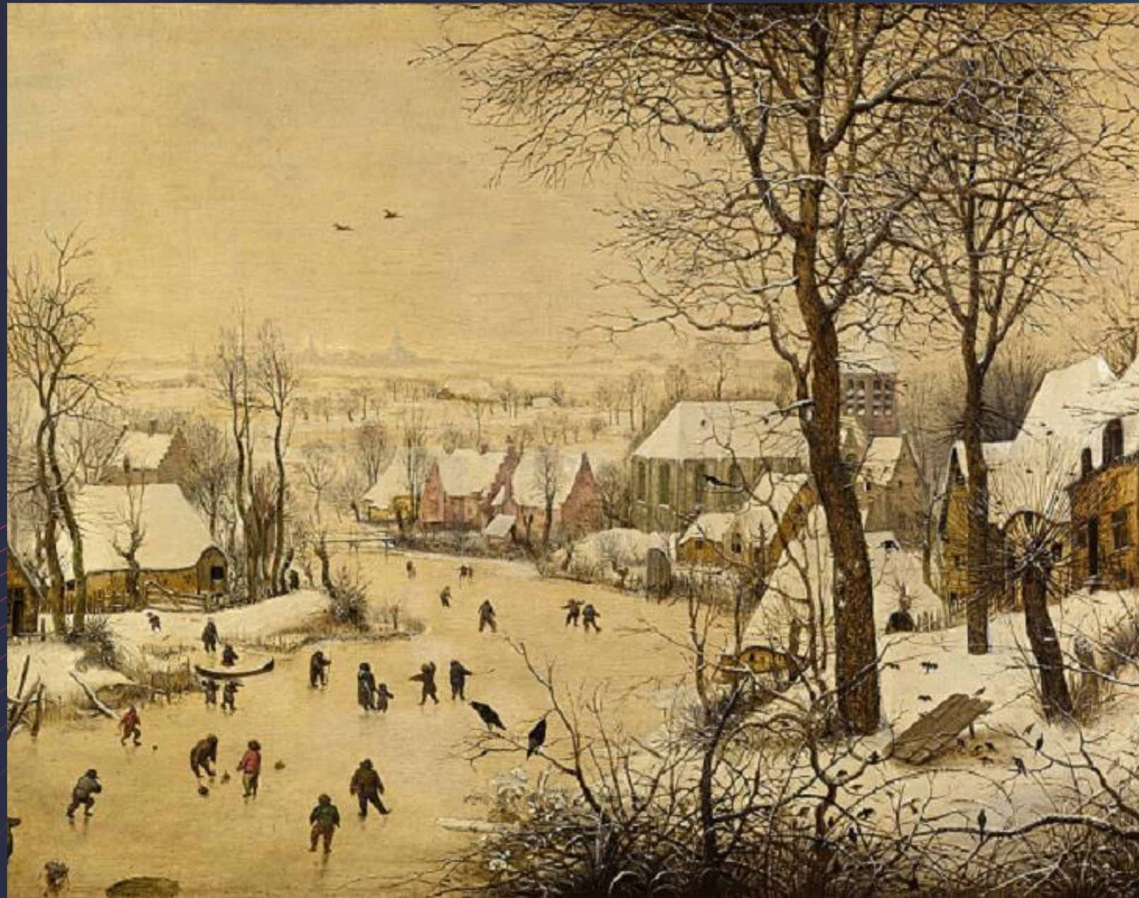
Питер Брейгель Старший. Зимний пейзаж с конькобежцами и ловушкой для птиц