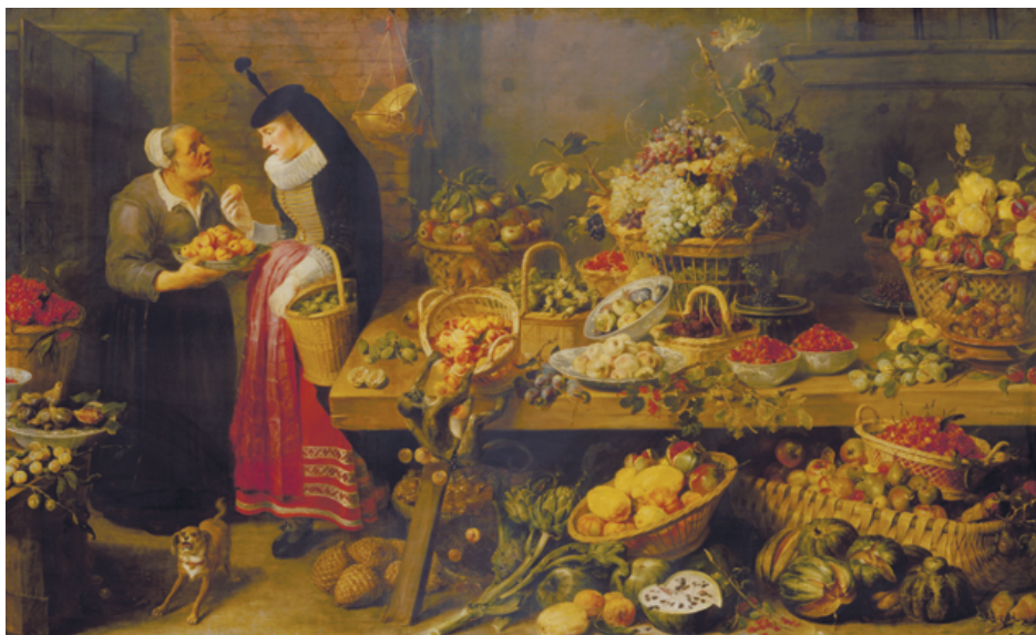
© Франс Снейдерс, «Фруктовая лавка», 1618–1621 гг.

Жизнелюбие фламандцев и присущая им широта природы воплотились в монументальных полотнах серии «Лавки» кисти Франса Снейдерса. Он был создателем совершенно особого типа натюрморта. Кажется, всё богатство даров природы собрано в его композициях, впечатляющих своим чисто барочным размахом, динамизмом и яркой красочностью. Тут и разнообразные плоды, и битая дичь, и всевозможная морская живность. Несмотря на то что эти лавки – плод авторской фантазии, Снейдерс демонстрирует в них исключительное знание природы, с неподражаемым мастерством передавая цвет и фактуру фруктов и овощей, заботясь при этом и о создании определенного декоративного эффекта, ведь эти полотна предназначались для украшения парадных апартаментов. Серия создана мастером в 1618-1621 гг. по заказу королевского сборщика налогов Жака ван Офема для его нового особняка в Брюсселе. По замыслу автора, картины могли служить аллегориями четырех природных стихий: Земли, Воды, Воздуха и Огня (Солнца) и «Пяти чувств». Картина «Фруктовая лавка», очевидно, символизирует Солнце, ведь именно с ним связано созревание фруктов и великолепного урожая. Неслучайно «Фруктовая лавка» - самая яркая в серии, а все цвета в ней объединены общим золотистым тоном.