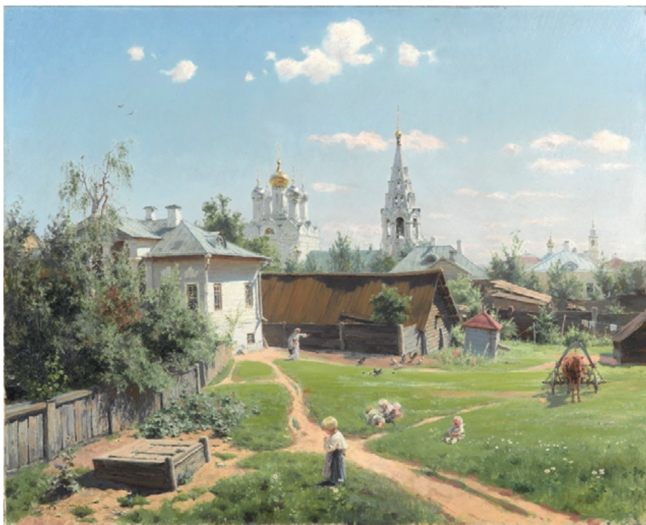
© Василий Дмитриевич Polenov, «Московский дворик», 1878 г.

Это самая известная картина Василия Polenova. В ней впервые наметился путь русского искусства 1870-х годов, которое стремилось к растворению жанрового начала, характерного для реализма передвижников. Изображена и ныне существующая церковь Спаса в Песках близ Арбата. Образ Москвы XIX века поражает почти деревенским укладом жизни. Художник отразил многомерный мир, в котором нашлось место и старинной усадьбе с тенистым запущенным садом, и храму, и заброшенным покосившимся сараям. В центре – заросший свежей травой пустырь. Он пересечен диагоналями тропинок, подчеркивающих глубину пространства. Ребенок на переднем плане, фигурка женщины с ведром воды и запряженная в телегу лошадка образуют треугольник композиции и подчеркивают соотношения масштабов. Играют дети, о чем-то плачет малыш, пасутся куры – весь хлопотливый маленький мирок согрет солнечным теплом. С одинаковой нежностью останавливается взгляд художника на венчике ромашки, золотой головке девочки и сияющей главке церкви, создавая гармоническую взаимосвязь малого и большего мира. Картина открывает период пленерной живописи Polenova. Этой работой художник дебютировал на 6-й выставке Товарищества передвижных художественных выставок. Произведение положило начало московскому периоду творчества Polenova.