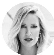
ЕЛЕНА ЛЕТУЧАЯ Тележурналист, телеведущая, продюсер, амбассадор фонда «Подари жизнь»