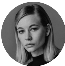
СВЕТЛАНА УСТИНОВА Актриса и режиссер