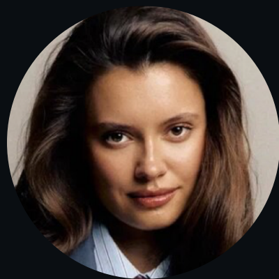
Катя Голден, телеведущая, инфлюенсер, основатель и креативный директор, LUVU