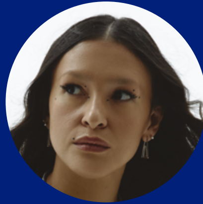
ЕКАТЕРИНА МАНОЙЛО Российская писательница и литературный обозреватель, автор романа «Отец смотрит на запад»