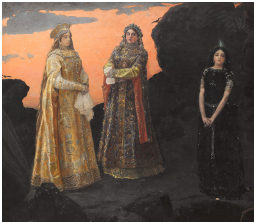
Виктор Михайлович Васнецов, «Три царевны подземного царства», 1881 г.