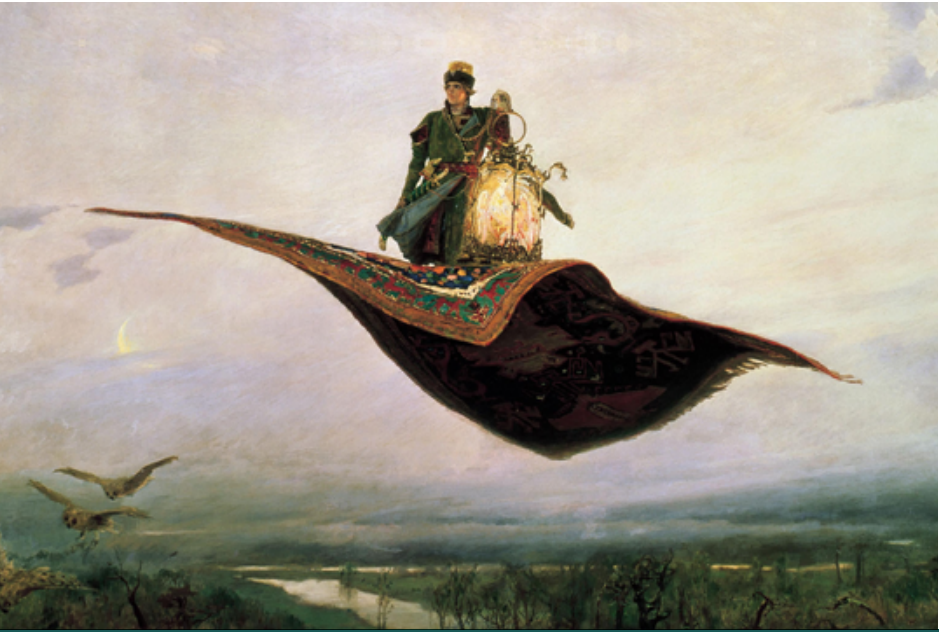
Виктор Михайлович Васнецов, «Ковёр-самолет», 1880 г.