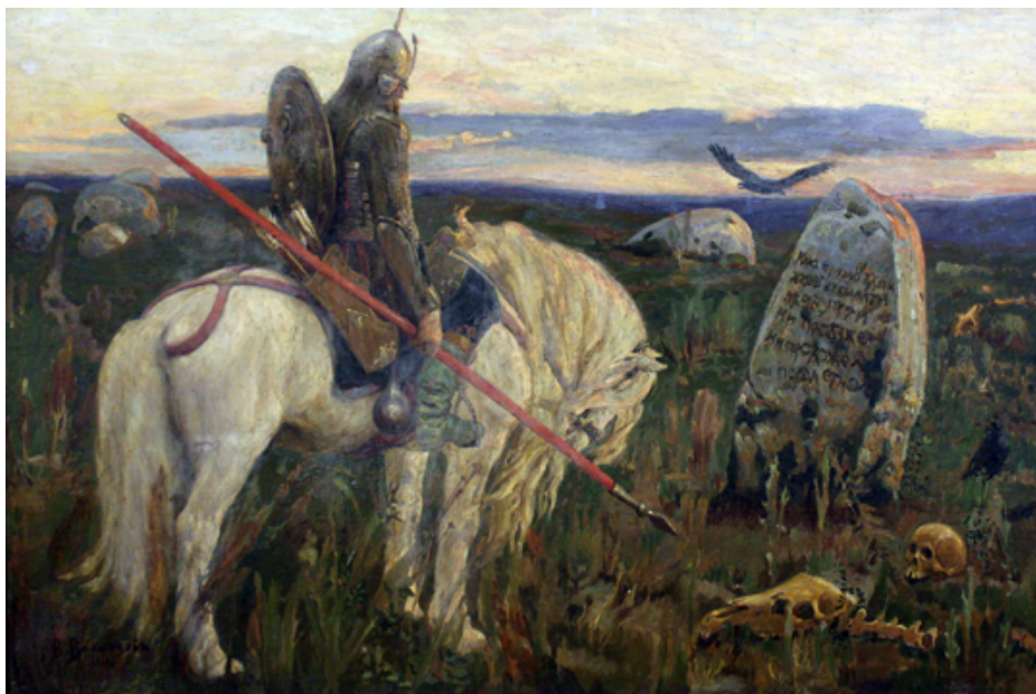
Виктор Михайлович Васнецов, «Витязь на распутье», 1882 г.