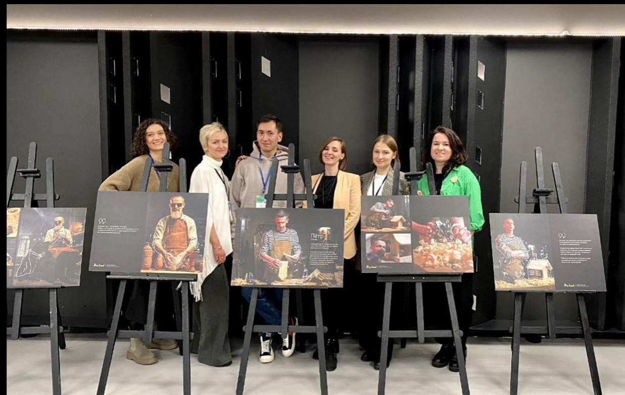
Пример пространства выставки «Магия ремесла»