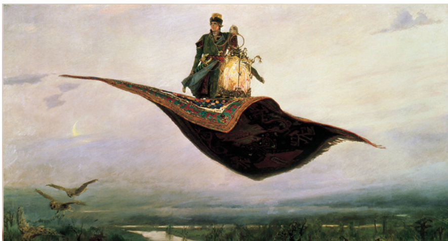
«Ковёр-самолет», 1880 г.

Умер 23 июля 1926 года в Москве, похоронен на Лазаревском кладбище. После его уничтожения прах художника был перенесён на Введенское кладбище.