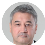
Александр Шойтов Заместитель министра цифрового развития, связи и массовых коммуникаций Российской Федерации