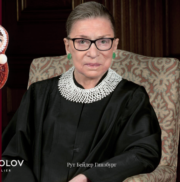
Рут Бейдер Гинзбург